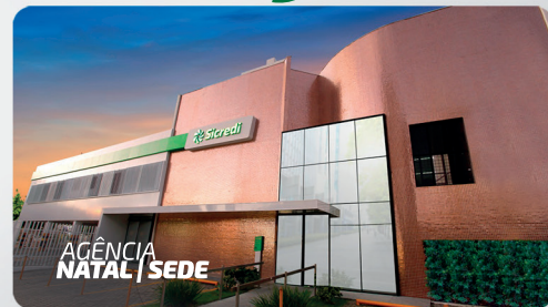
AGÊNCIA NATAL | SEDE

GENTE QUE COOPERA, CRESCE. E ainda consegue abraçar sua terra.