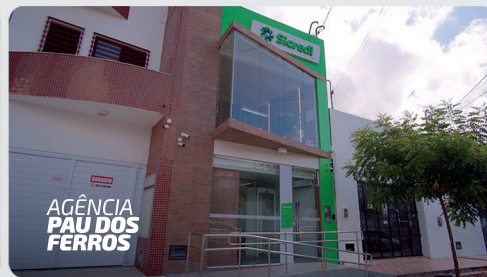
AGÊNCIA PAU DOS FERROS