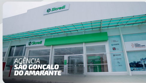
AGÊNCIA SAO GONCALO DO AMARANTE