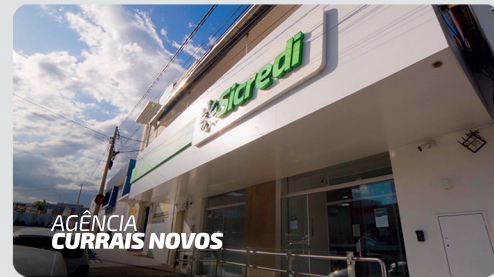
AGÊNCIA CURRAIS NOVOS