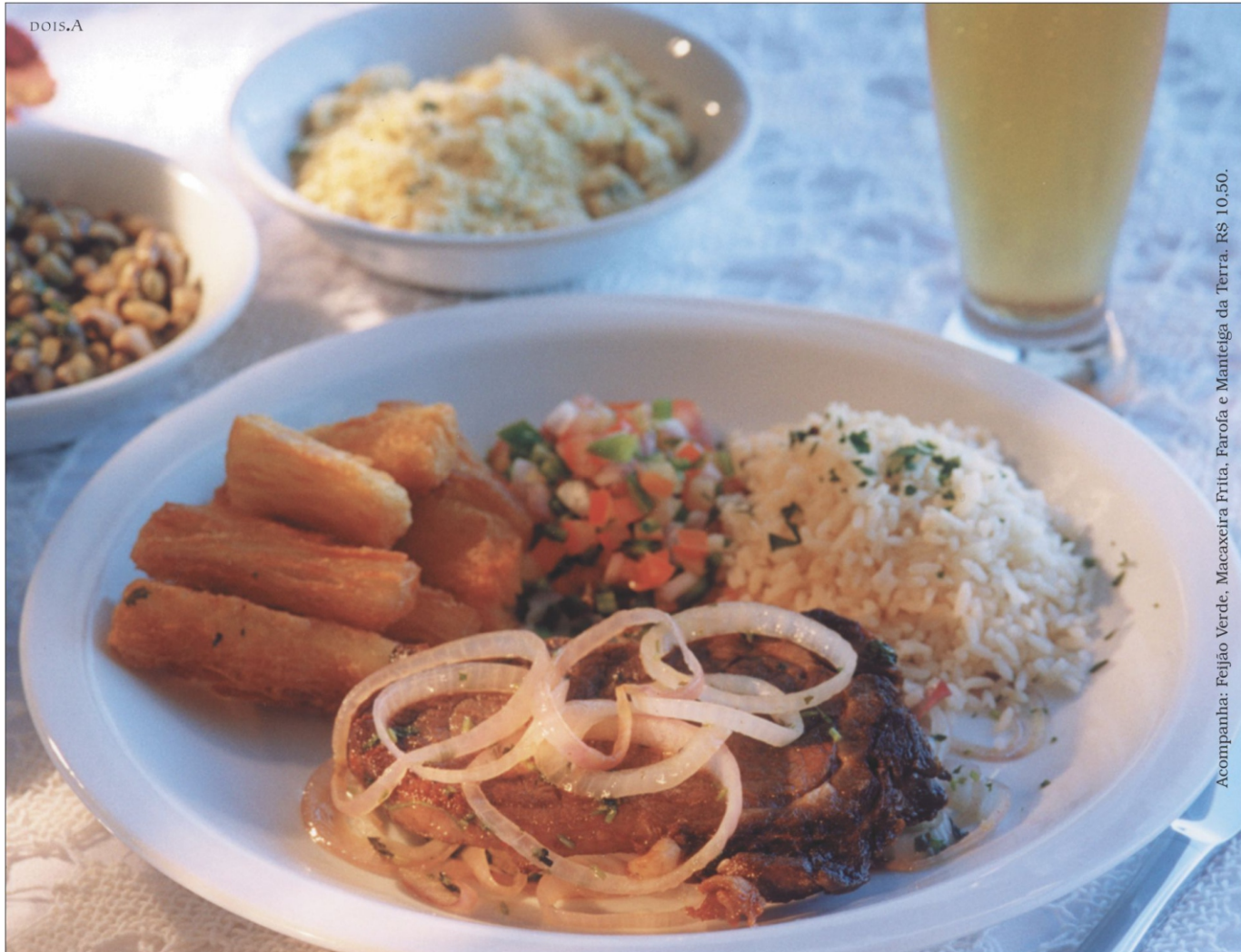
Acompanha: Feijão Verde, Macaxeira Frita, Farofa e Manteiga da Terra. R$ 10.50.